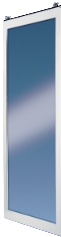
DORMA HSW-R Glazen stabiel geraamd schuifpaneel