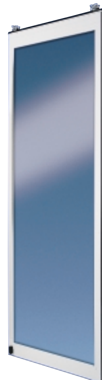
DORMA HSW-ISO Isolatieglas-schuifpaneel met frame van thermisch gescheiden profielen