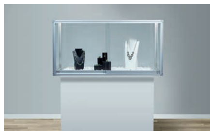
Vitrinebeslag met e Secura