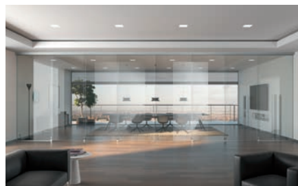
Portavant 150 multiline