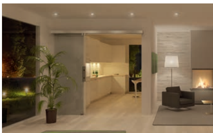
Portavant 60 twinline